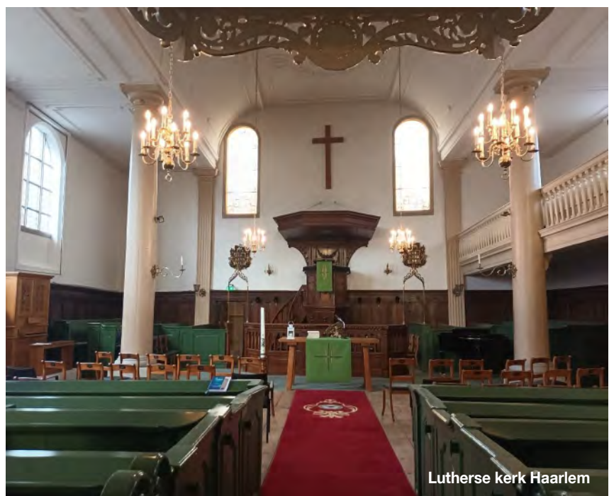
Lutherse kerk Haarlem