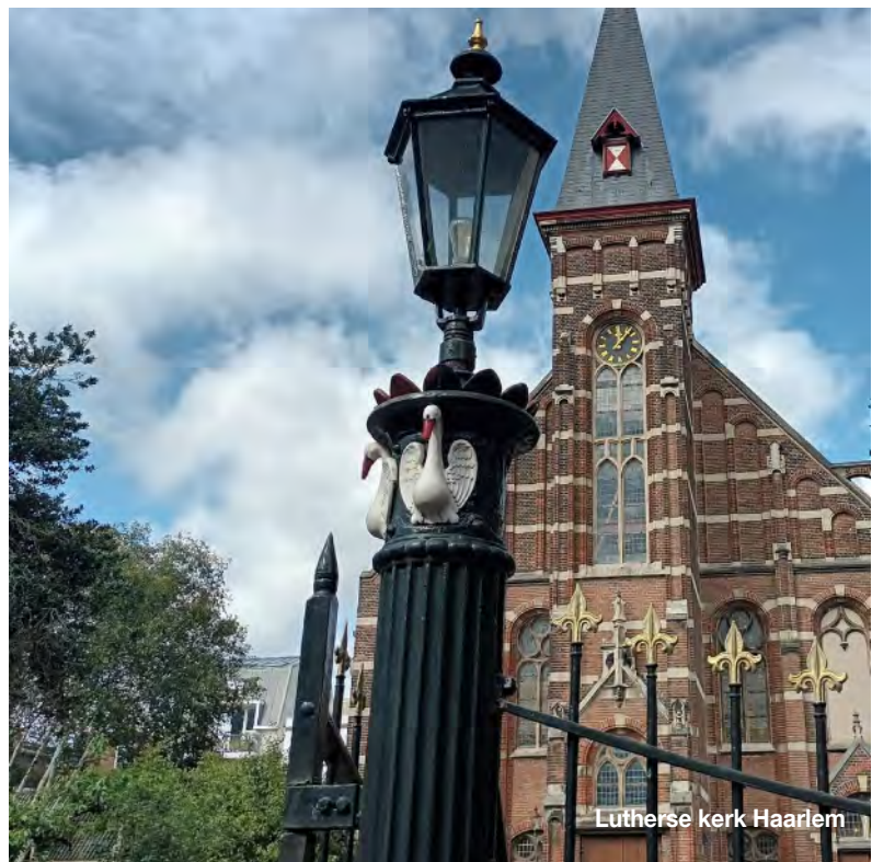
Lutherse kerk Haarlem